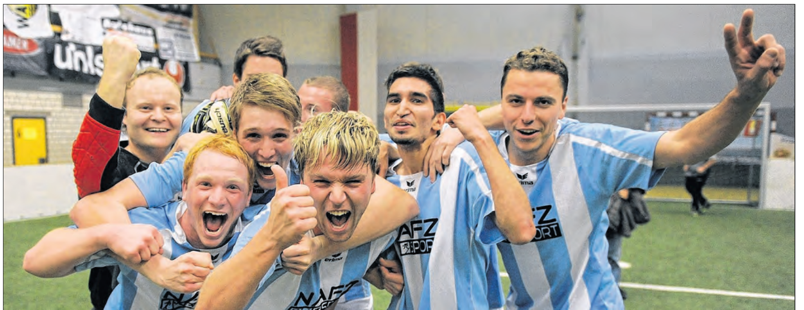
Grenzenloser Jubel: Die Spieler der SG Altheim-Grünmettstetten feiern ihren Turniersieg in der Hohenberghalle.

SG Altheim-Grünmettstetten – SSV Dettensee 2:2, 5:3 n.V.