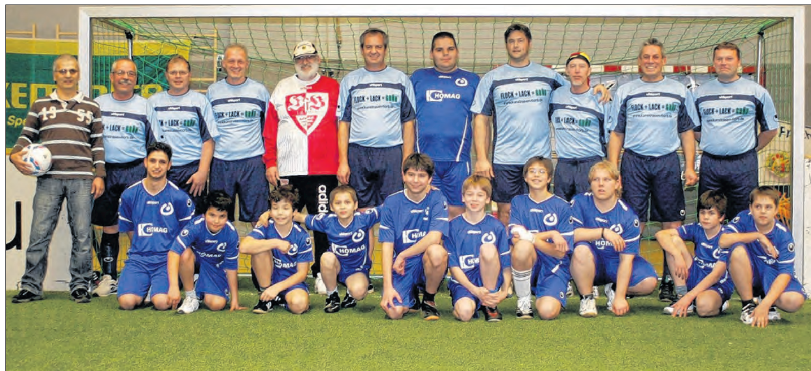
Keine Chance für das Promi-Team: Die Spieler der Lebenshilfe Horb ließen im Einlagespiel der Prominentenmannschaft keine Chance – 5:2.